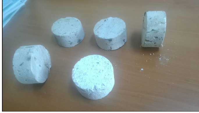
Şekil 1: Disk şeklinde kayaç numuneleri

Deney için 10 adet yuvarlak disk şeklinde numune önerilmektedir (Şekil 1). Numune kalınlıkları yaklaşık olarak kendi yarıçaplarına eşit olmalıdır ( L/D = 1/2 ). Numune çapları en az 54,7 mm (NX) olmalıdır. Numune yüzeyleri birbirine paralel ve düşey eksene dik olmalıdır. Numune alt ve üst yüzeyleri 0.25 mm içinde düzgün olmalıdır.