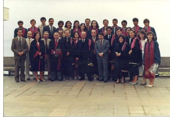
Resim 10. Hacettepe Üniversitesi Trabzon Tıp Fakültesinden naklen gelen öğrencilerin mezuniyet töreni-1985 yılı, Çamlık

Zaman içerisinde tıpta gelişmelere paralel olarak yeni anabilim dallarının ve bazı yan dalların ortaya çıkışı ile Fakülte bünyesinde de 1990'lı yıllardan sonra yeni Anabilim/Bilim Dalları kurulmuştur (Tablo 4).