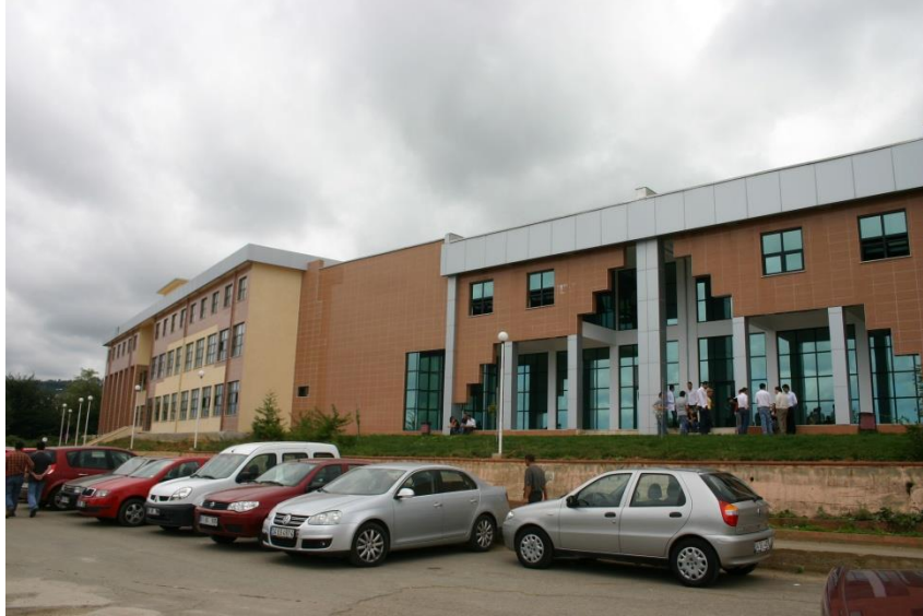
Resim 11. Tıp Fakültesi ek eğitim binası

ihtiyacı doğmuştur. Bu kapsamda, 2000-2004 yılları arasında Dekan Prof. Dr. İbrahim Özen zamanında, bugün dekanlık binasının doğu tarafında bulunan “Tıp Fakültesi Ek Eğitim Binası” inşa edilerek kullanıma girmiştir (Resim 11). Diğer yandan tüm dünyada ve türkiyede tıp eğitiminin standardizasyonu kapsamında başlatılan akreditasyon çalışmaları 2000’li yıllardan sonra KTÜ Tıp Fakültesinde de başlatılmış ve fakülte mezuniyet öncesi eğitim programı 01 Ocak 2013 tarihi itibarıyla UTEAK tarafından akredite edilmiştir.