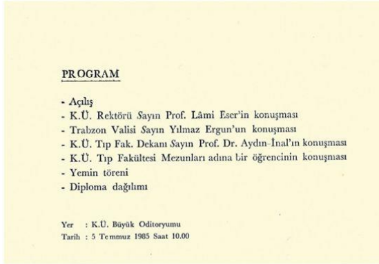
Resim 9. 1985 yılı mezuniyet törenine ait davetiye

Bu arada KTÜ Tıp Fakültesi 1982-1983 eğitim-öğretim yılında kendi bünyesine aldığı öğrencilerin eğitimlerini 1988 yılı itibariyle tamamlayarak ilk mezunlarını verir. Ancak daha öncesinde de Hacettepe'den aktarılan ara sınıfların mezuniyet törenleri peyder pey yapılmıştır (Resim 9-10).