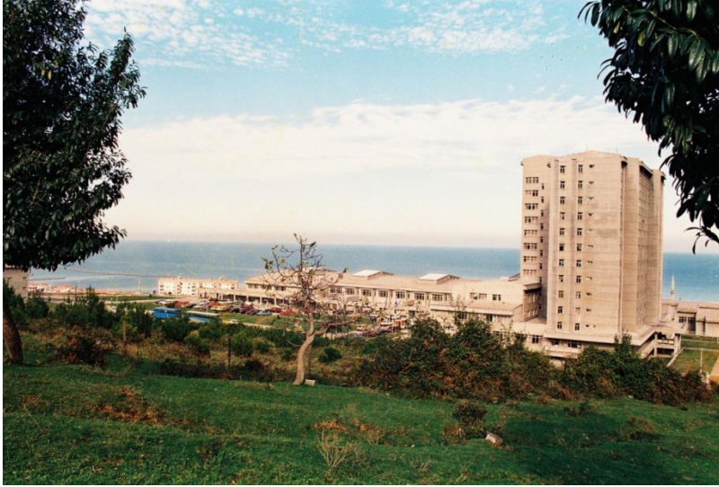
Resim 8. Tıp Fakültesi A-blok ve poliklinikler (1987 yılı)

19 Mart 1986 günü alınan YÖK kararı ile, o zamana kadar fakülte bünyesindeki birçok bilim dalı, anabilim dalına dönüşmüştür (Tablo 3).