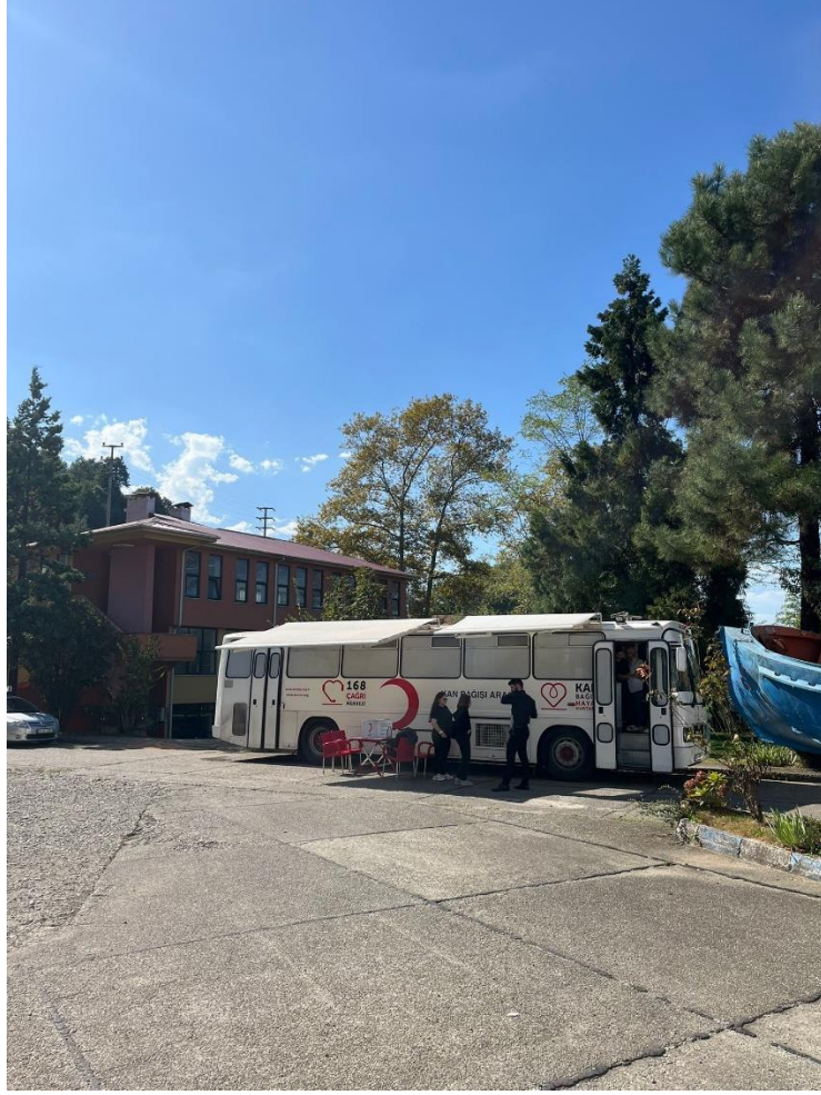
Fakültemiz personel ve öğrencilerden Kızılay'a kan bağışı