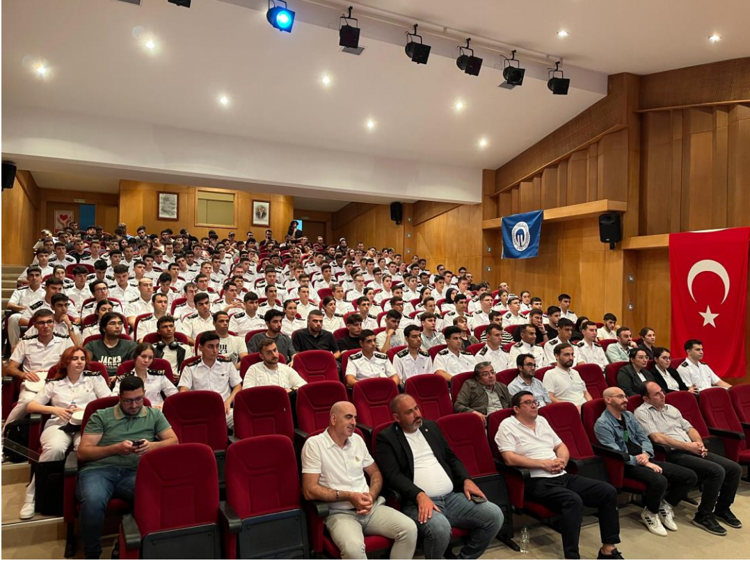
2024-2025 Eğitim-Öğretim Dönemi Fakültemiz Oryantasyon Toplantısı