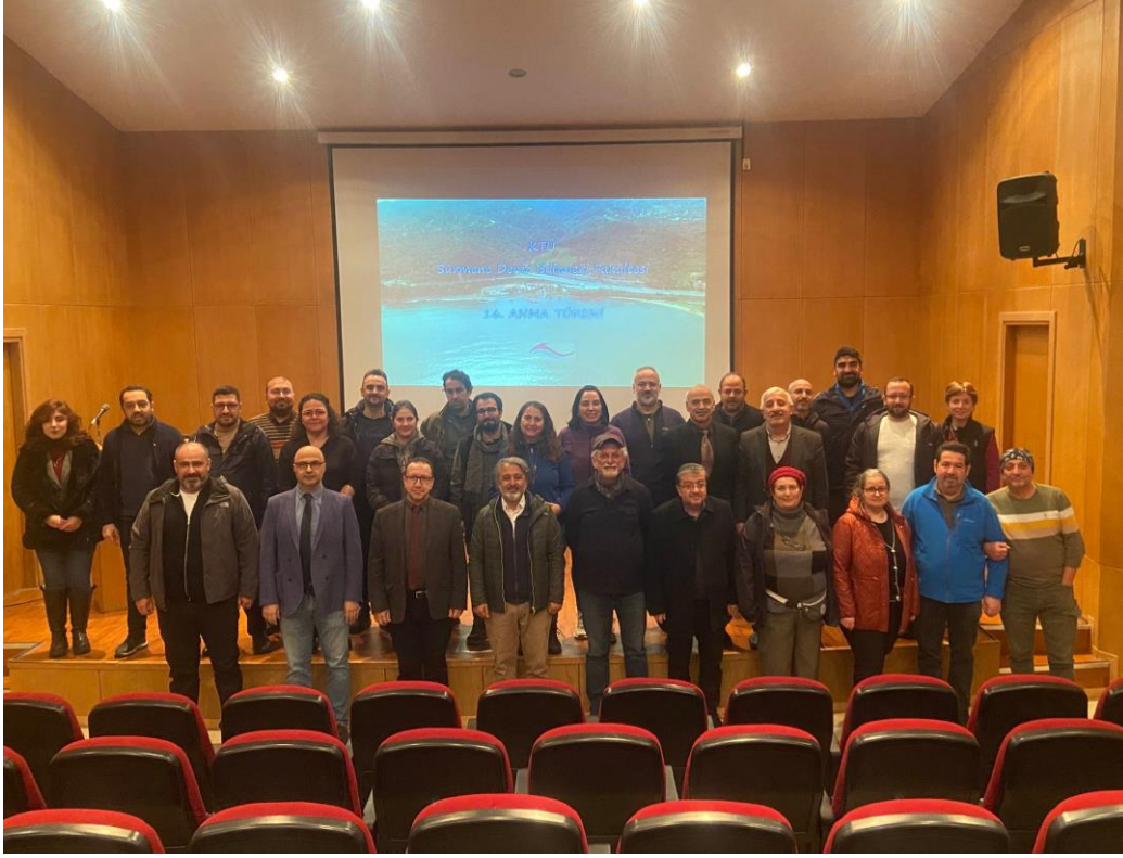
Fakültemiz 16. Anma Töreni