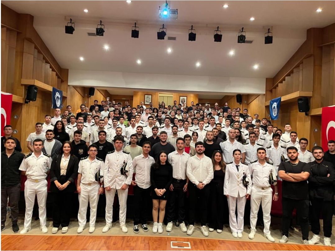
Denizci Öğrenciler Derneği Seminer