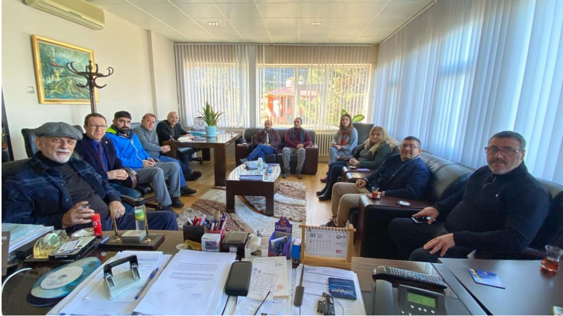
2024-2024 Stratejik Plan Toplantısı