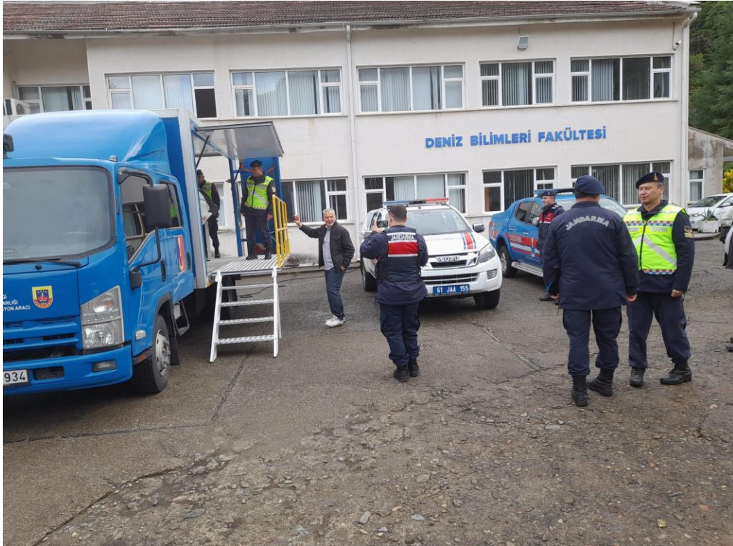
Emniyet Kemerli Farkındalık Eğitimi