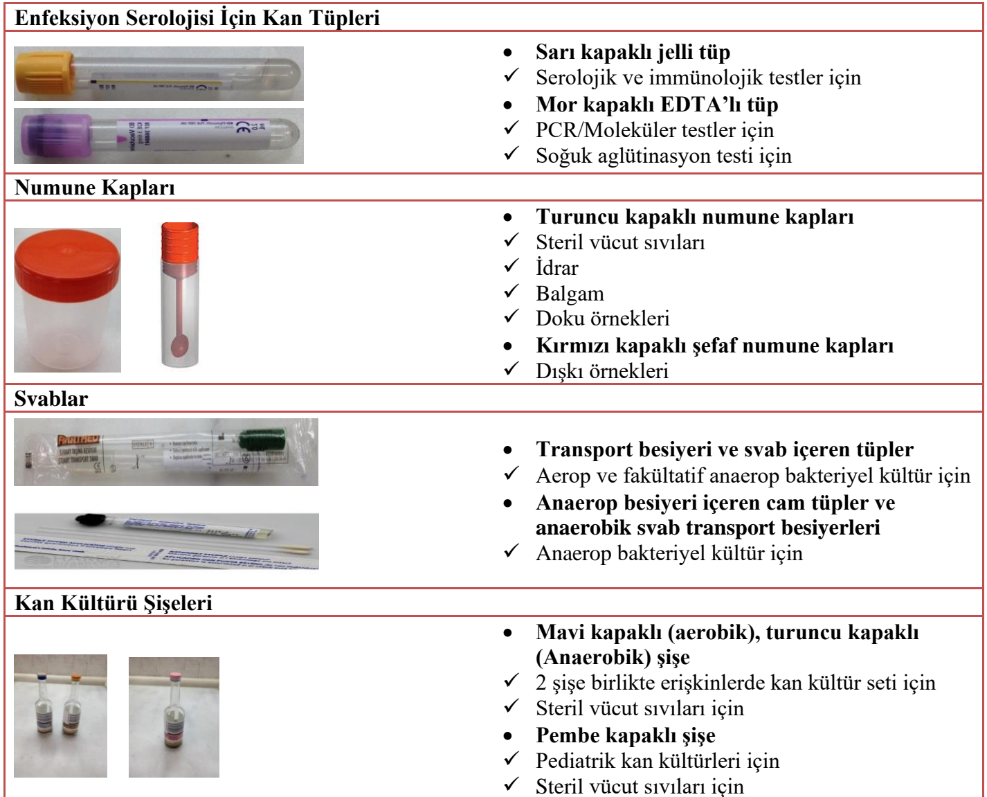
Tablo 2. Örnek gönderme kapları