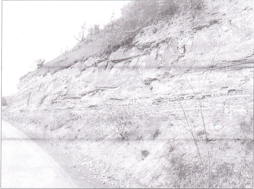
Şekil 3. Gözalan Mahallesi'nde yüzeyleme veren Çağlayan Formasyonunda ait kumtaşı, kıltaşı, kireçtaşı ve marn ara seviyeleri içeren tortullar.