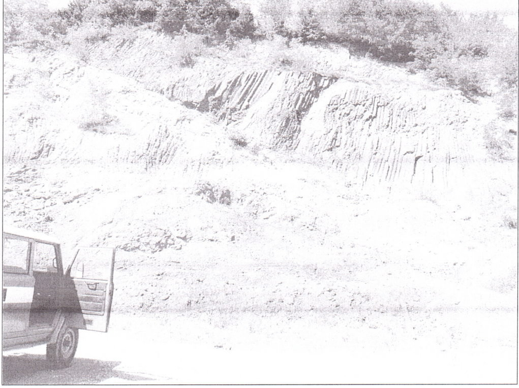
Şekil 2. Gözalan Mahallesi'nde yüzeyleme veren Çağlayan Formasyonunda ait yüksek derecede ayrılmış prizmatik yapı gösteren bazaltlar