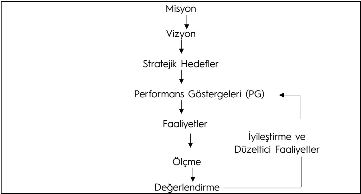
Şekil 2. Süreç Yönetimi ve Stratejik Planlama İlişkisi

KTÜ, stratejik planı ile ortaya koymuş olduğu politika ve stratejilerini gerçekleştirmesini sağlayacak yol haritasının belirlenmesinde Süreç Yönetimini benimsemiştir. Bu yaklaşım ile farklı iş süreç ve sistemlerinin bütünleştirilmesiyle iş akışının tüm birimlerde belli standartlarla sağlanmasını, iş akışlarındaki tespit edilen sorunların belirlenerek iyileştirilmesini bu suretle verimliliğin artması ve kaynakların etkin kullanımını amaçlamaktadır. KTÜ, kurumsal performansını stratejik planda yer alan hedefler ve hedeflere ilişkin performans göstergeleri ve süreç yönetimi kapsamında Süreç Yönetimi El Kitabında yer alan süreç performans göstergeleri ile takip etmektedir. Süreç yönetimi, stratejik yönetimin en önemli unsurlarından biridir.