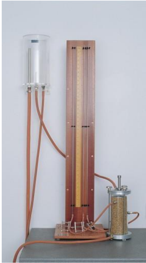
Şekil 1. Sabit seviyeli permabilite deney cihazı