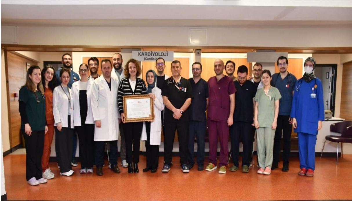
Resim 3. Kardiyoloji Anabilim Dalı

Fakültemiz Kardiyoloji Anabilim Dalı uzmanlık eğitimi, Türk Kardiyoloji Yeterlilik Kurulu tarafından ikinci kez akredite edildi (Resim 3).