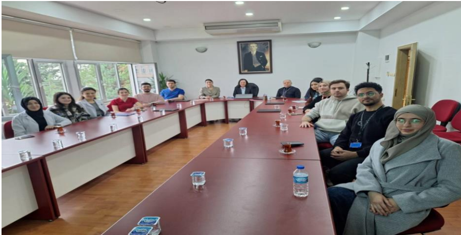
Resim 2. Dekan ile tanışma ve bilgilendirme toplantısı

Uyum eğitimlerinde küçük gruplar halinde Dekan ile tanışma ve bilgilendirme toplantıları gerçekleştirdi (Resim 2).