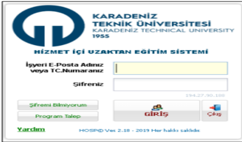
Resim 1. Hizmet İçi Uzaktan Eğitim Sistemi ( https://isg.ktu.edu.tr:8075/ )

Uyum programı 2024 yılı içerisinde göreve yeni başlayan araştırma görevlilerine yönelik web tabanlı olarak TUS dönemleri sonrasında iki periyot halinde gerçekleştirildi. Uyum eğitimine Karadeniz Teknik Üniversitesi Hizmet İçi Uzaktan Eğitim Sistemi üzerinden ktu uzatılı e-mail adresi ve şifresi kullanılarak ulaşılabilmektedir (Resim 1).