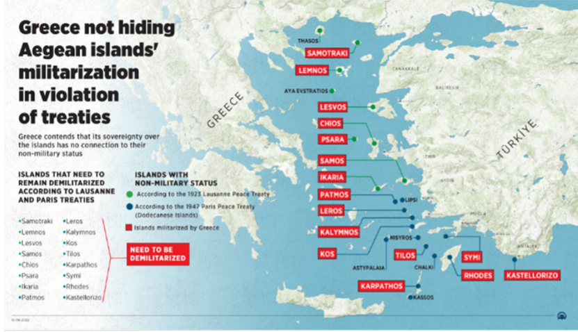
Tablo 3: Yunanistan Tarafından Silahlandırılan Adalar