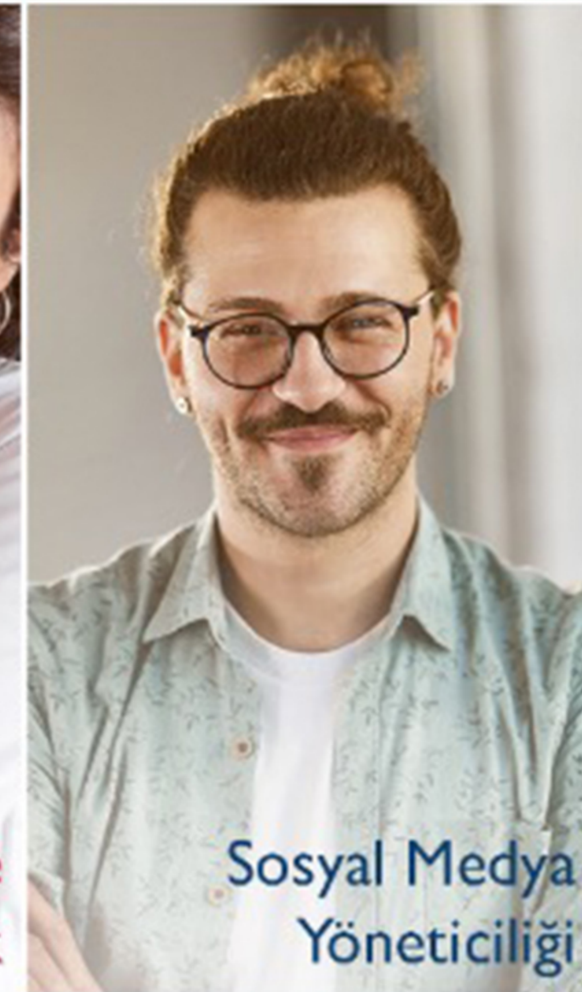
Sosyal Medya Yöneticiliği