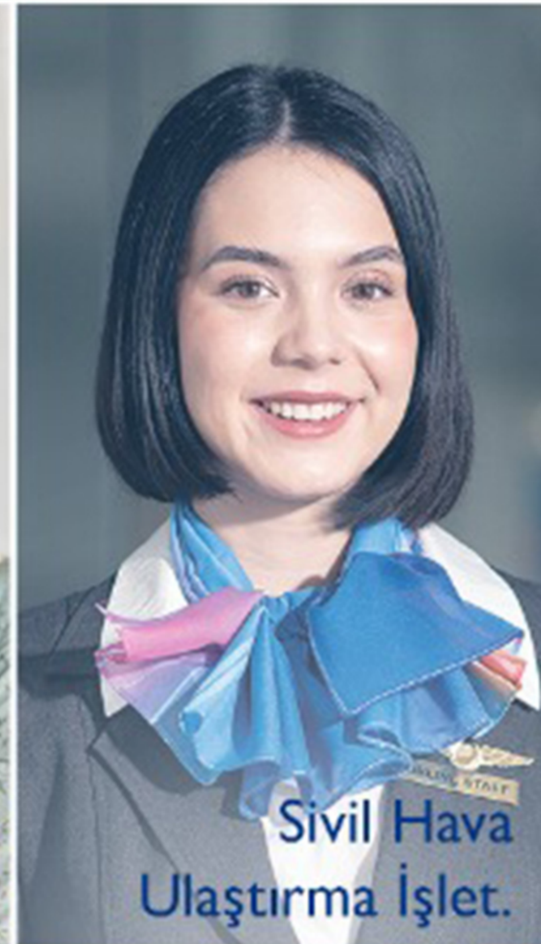
Sivil Hava Ulaştırma İşlet.