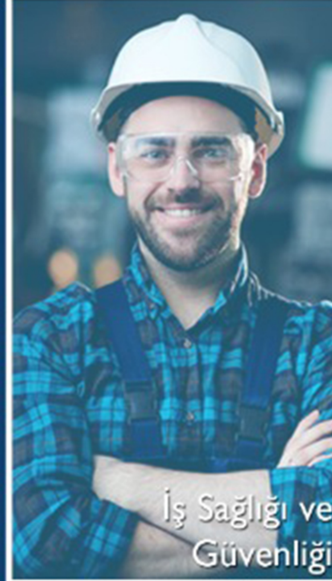
İş Sağlığı ve Güvenliği