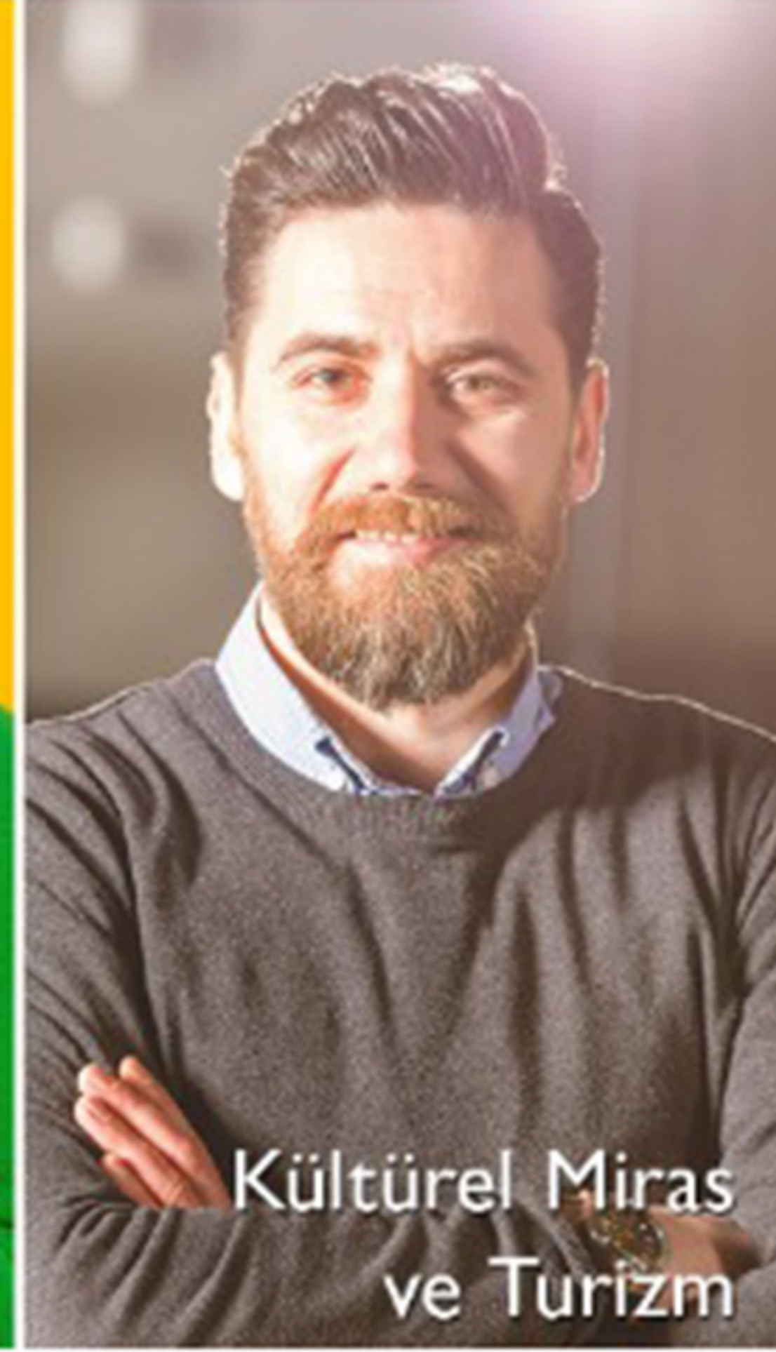
Kültürel Miras ve Turizm